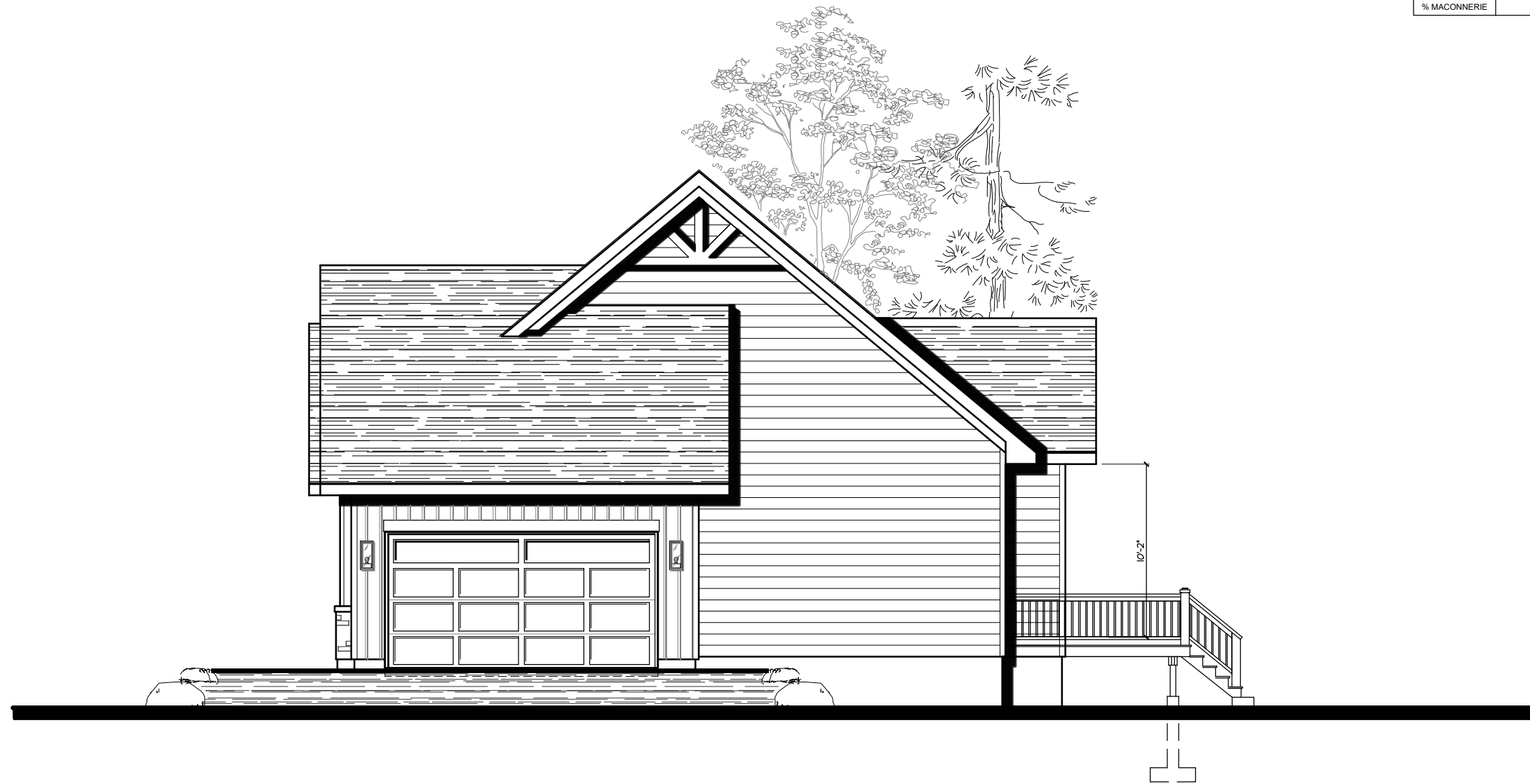
ÉLÉVATION COTÉ DROIT